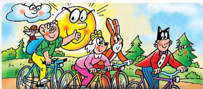
Správné vidění zdravých očí