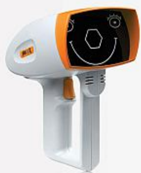
Speciální vyšetřovací kamera PlusoptiX