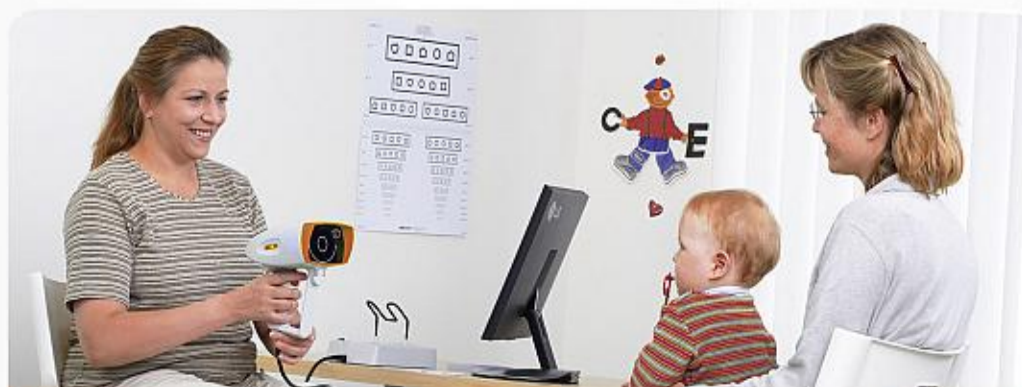
Vyšetření je rychlé a zcela bezpečné